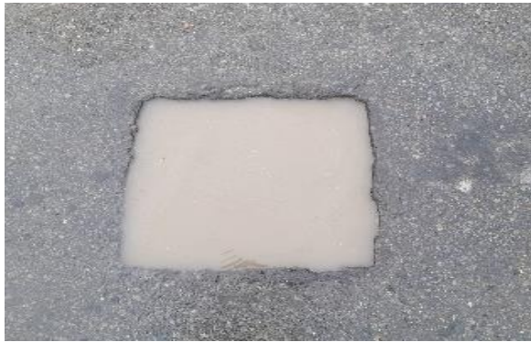
①疑似ポットホール (滞水状態)